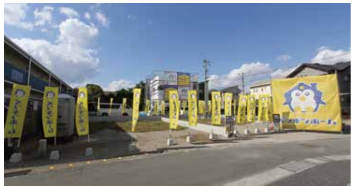
PENGUIN HOME 新築事業部 分譲地