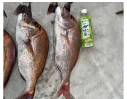
◇500mlのペットボトルとの比較